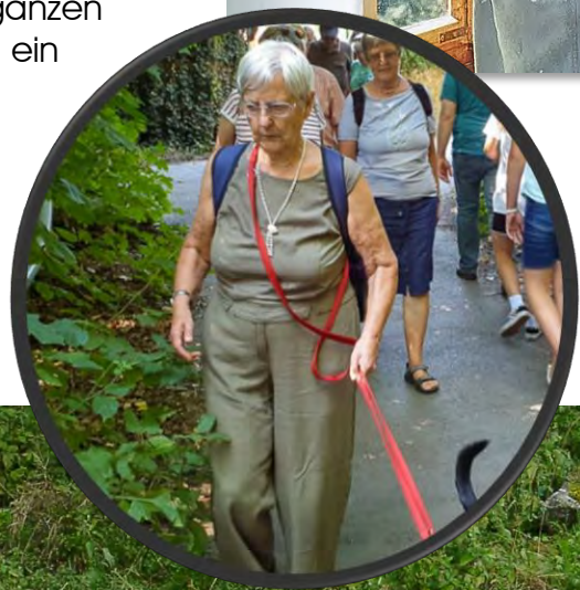
Die Weggefährt*innen der Gruppen in Groß-Gerau